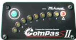
緑色と赤色のみ点灯:地盤不良や軟弱地盤の場合 緑色と赤色のみ点滅:断線等故障の場合