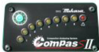
緑色点滅:振動が正常でない場合

転圧センサーは、新制御方式の加速度センサーを内蔵しています (MVH-308・408・508) 施工目標となる地盤硬度に応じてLEDランプが点灯し、転圧回数と作業時間を節約できます。