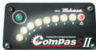
LEDランプ点灯例 黄色:1~8 赤色:締固め限界*

*締固め限界を示す赤色ランプは必ずしも点灯いたしません。地盤により赤色ランプ点灯以前に、目標となる地盤硬度に達する場合がございます。