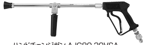
ハンドチェンジガン AJG80-30VSA (ハンドルで直射・円錐パターンに可変)