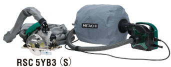
RSC 5YB3 (S)