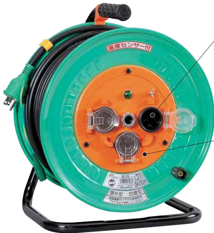
本体用防雨コンセント