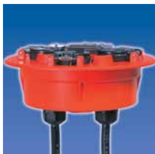
NWは防雨・防塵に優れたユニット構造