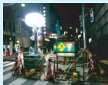
夜間の街中工事に