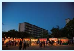
イベント等の仮設照明に