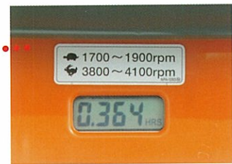
タコアワーメーター